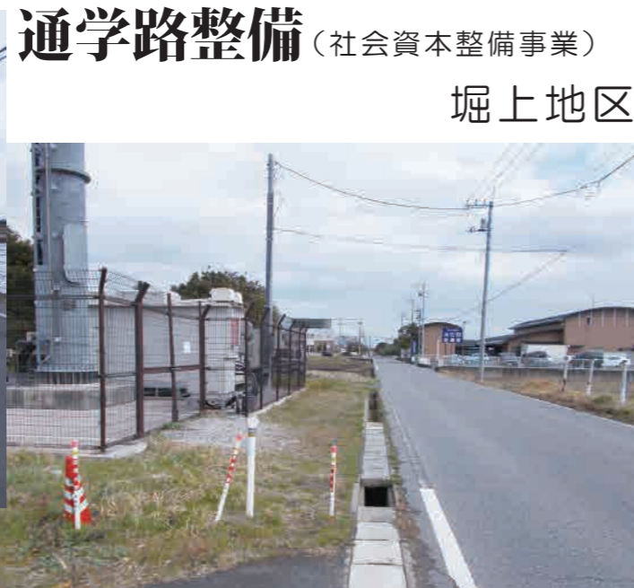
通学路整備 (社会資本整備事業) 堀上地区