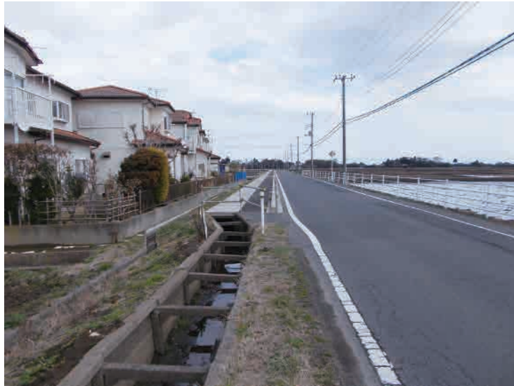
豊成地区 子どもたちが安心して通学できるように歩道を整備します