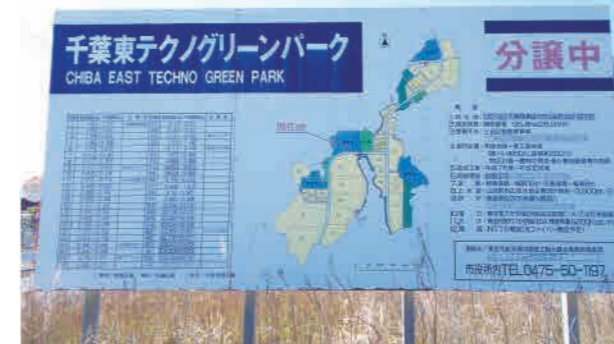
働く場を確保 企業誘致を促す