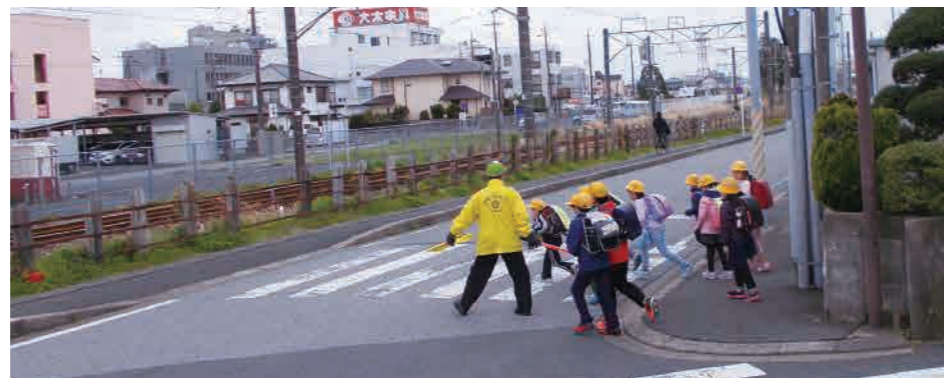
地域の力 学童の見守り